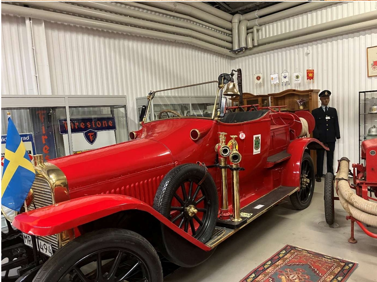
Text och foto Lennart Hedberg